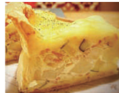
手作りパイ生地キッシュ