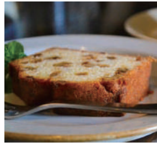
クルミのパウンドケーキ