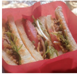
タコスミートサンド