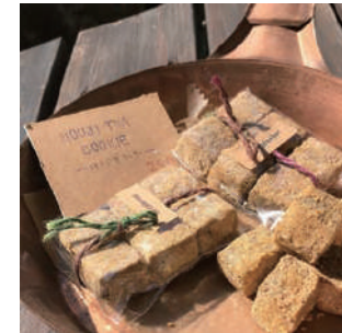
ほうじ茶クッキー