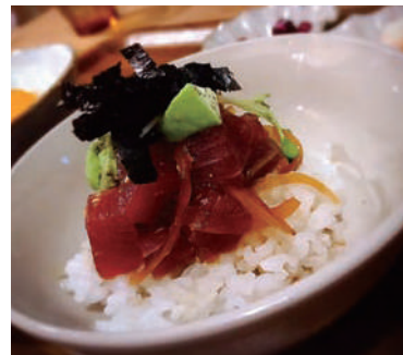
マグロとアボカド アヒポキ丼