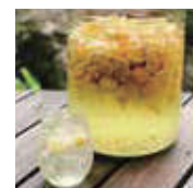
自家製レモンスカッシュ