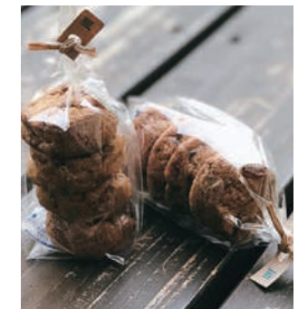
ブラウンクッキー